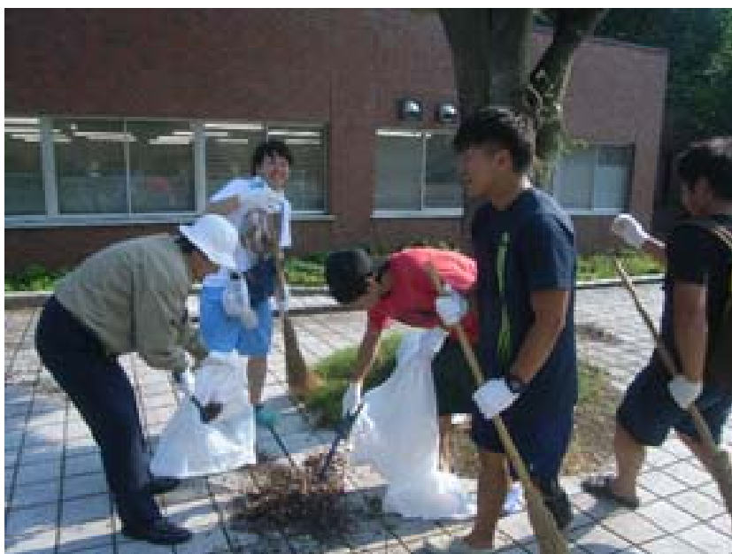
学生と一緒に落ち葉を拾う佐藤学長（左）

当日は蒸し暑い気候であったが，学長をはじめとして多数の学生及び教職員の参加があり，オープンキャンパスに向けクリーンなキャンパスとなった。