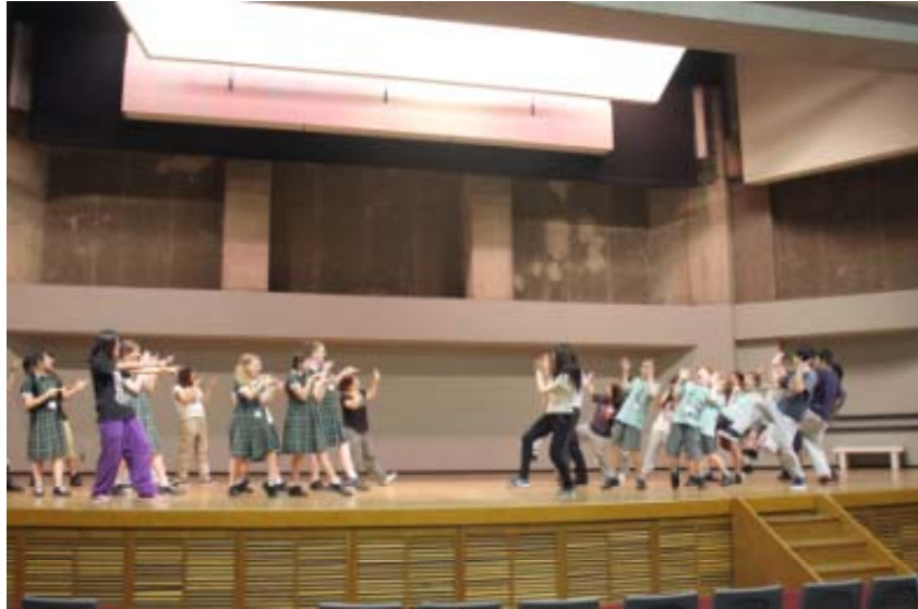
ストリートダンス部との交流