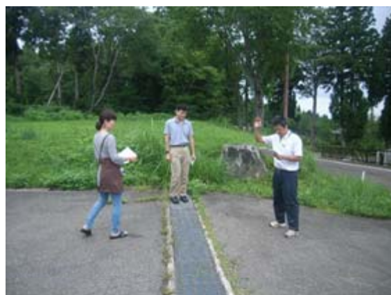
管理人による宿泊者の点呼

今回の訓練では、大規模地震が発生し、大きな被害が生じたことを想定して、施設管理人による宿泊者の避難誘導、安否確認、大学への通報を実施するとともに、同施設の所在地である妙高市における指定避難所の位置を確認し、より一層の防災に対する意識向上が図られた。